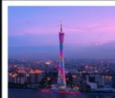
แคนตันทาวเวอร์