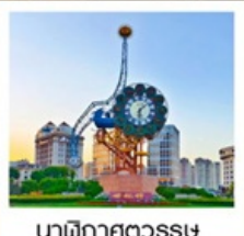
นาฬิกาตวรรษ