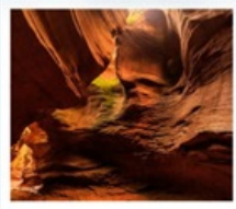
แกรนด์แคนยอนยูดาโกว