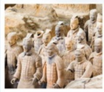
พิพิธภัณฑ์กองทัพใต้ดิน

หมู่บ้านการ์เอ๋อเป้อ / อุทยานอ้วนชิวชาน (รวมรถแบตเตอรี่) ถ้ำน้ำแข็งอ้วนชิวชาน / อุทยานอ้วนชิวชาน / น้ำตกหูชิว (รวมรถแบตเตอรี่) ที่ทำการประธานเหมา / แกรนด์แคนยอนยูดาโกว (รวมรถแบตเตอรี่) ถนนคนเดินวัฒนธรรมต้าถิง / กำแพงเมืองโบราณซีอาน / เจดีย์ห่านป่าใหญ่ พิพิธภัณฑ์กองทัพใต้ดินทหารม้าจีนซี (รวมรถแบตเตอรี่)