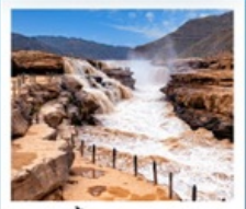
น้ำตกหูชิว