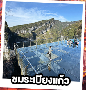
ชมระเบียบแก้ว