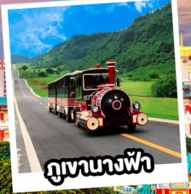
ภูเขาทางฟ้า