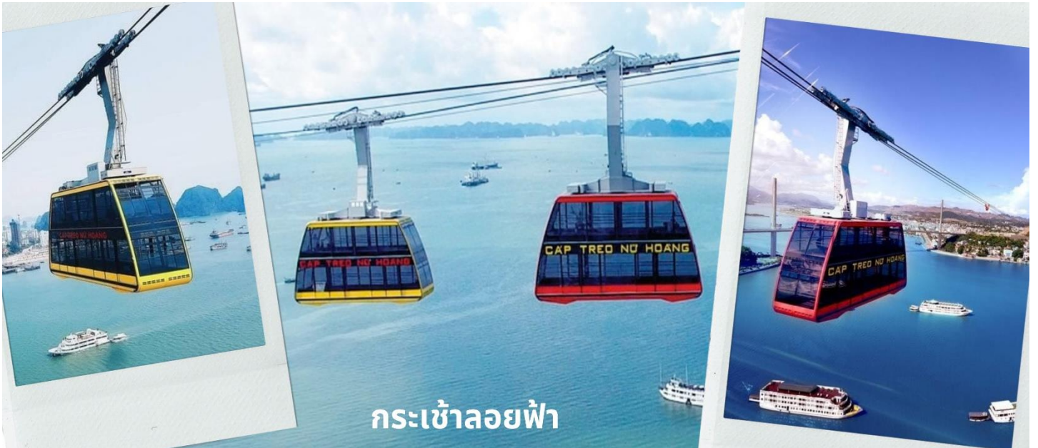
กระเช้าลอยฟ้า

จากนั้นนำท่านนั่ง Queen Cable Car กระเช้าลอยฟ้า 2 ชั้นที่ใหญ่ที่สุดในโลก จุคนได้มากถึง 250 คนต่อเที่ยว สามารถรับ-ส่งผู้โดยสารได้มากถึง 2,000 คนต่อชั่วโมง กระเช้าลอยฟ้า 2 ชั้นยิ่งใหญ่อลังการนี้เป็นส่วนหนึ่งของสวนสนุก Sun World Halong Park สร้างโดย Doppelmayr/Garaventa Group จากประเทศสวิตเซอร์แลนด์และออสเตรเลีย โดยมีความพิเศษที่สามารถทำลายสถิติโลก และได้รับการบันทึกลงใน Guinness World Records ถึง 2 รายการ คือ เป็นกระเช้าที่จุคนได้มากที่สุดในโลก และมีเสาคอนกรีตส่งกระเช้าที่สูงที่สุดในโลก ด้วยความสูงถึง 188.88 เมตร