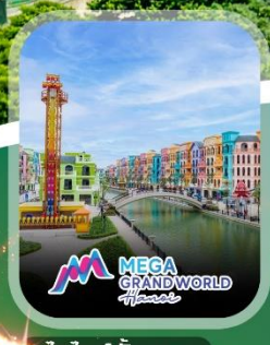
ไฮไลท์ทั้งหมด

คอนเฟิร์มออกเดินทาง ทุกพีเรียด 2 ท่านขึ้นไป