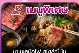
เมนูพิเศษ นาเบะคินอิโง สัตสึเมะ

ชิบิโร-ฮาชิว่า-ลานสกีซึกิไซ-คลองโอตารุ-โรงงานช็อกโกแลต-หมู่บ้านเทพนิยาย-ช้อปปิ้งทากุจิโคจิ-อิสระเต็มวัน