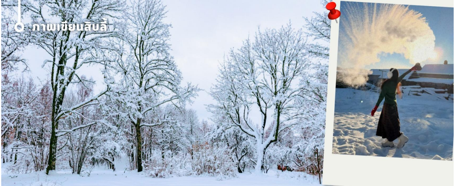
ภาพเขียนสิบลี

นำท่านเดินทางสู่ เขาป้างฉุย เดินชมวิวกวทัศน์ ซึ่งอยู่ใกล้กับหมู่บ้านหิมะ ทางเดินเป็นถนนที่สร้างด้วยไม้เป็นลักษณะขั้นบันได มีความยาว 3,200 เมตร เพื่อชมวิวมุมสูงของหมู่บ้านหิมะ และเป็นจุดที่ถ่ายรูปที่สวยงามที่สุดของ หมู่บ้านหิมะ