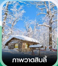
ภาพวาดสีบลู