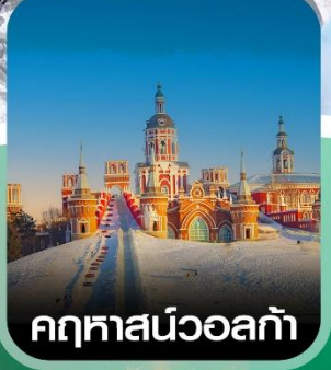
คฤหาสน์วอลกา