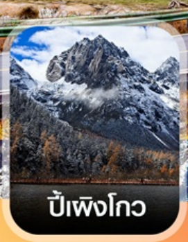
ปีเพิงโกว

✈️ คอนเฟิร์มออกเดินทาง ✈️ ทุกพีเรียด 2 ท่านขึ้นไป