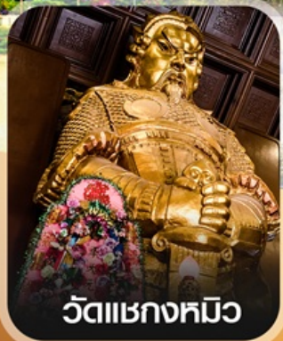
วัดแซงกหวีว