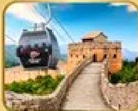
ถ่ายภาพเมืองจีน ด่านซือหม่าโต (รวมกระเช้า)