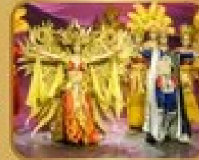
ชมการแสดงละครเวที THE GOLDEN MASK DYNASTY