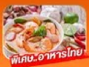
พิเศษ! อาหารไทย