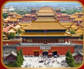
เขื่อนมรดกโลก พระราชวังกู้กิง