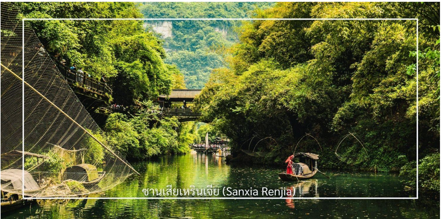
ซานเซียเหรินเจีย (Sanxia Renjia)

เช้า บริการอาหารเช้า ณ โรงแรมที่พัก (มื้อที่1)