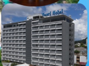
โรงแรมเพิร์ล