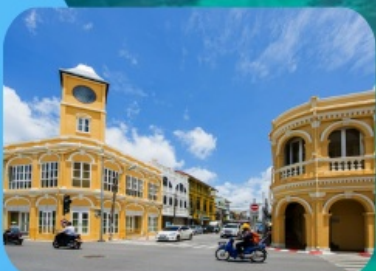
ภูเก็ตเมืองเก่า