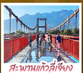
สะพานแก่วลี่เจียง