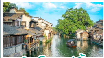
เมืองโบราณอู่จิ้น