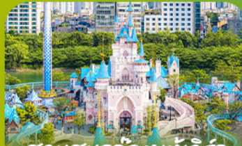
สวนสนุกโลกอเวเจอร์ Lotte Adventure World