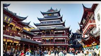
ตลาดร้อยปีฉิงหวงเหมียว