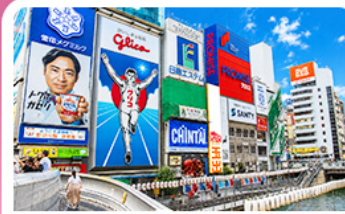
ชินโซบาชิจิ