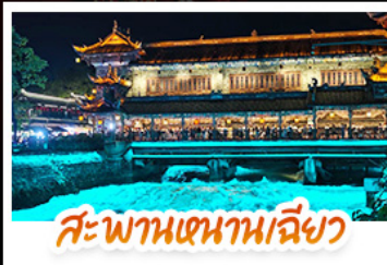
สะพานเจ้านานเฉียว