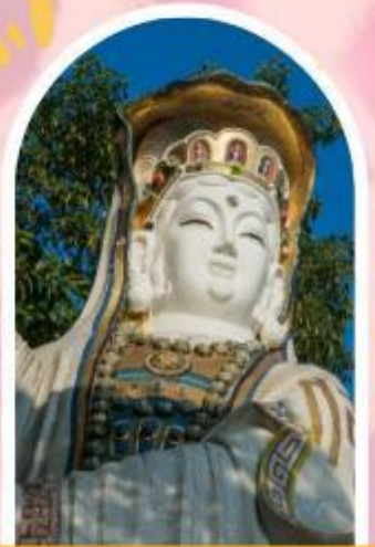
ริพลัสเบย์ รับพลังงานดี เสริมพลังดวงจัญ