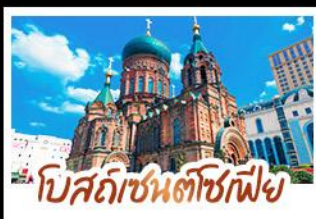
โบสถ์เซ็นต์โซเฟีย