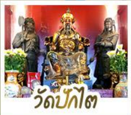
ว้ดป้กไต่