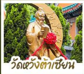
ว้ดแ่ว้งถ้่าเซ้งน