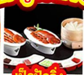
เปิดปิ้งกั๊ง