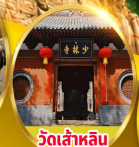
วัดเล่าหลิน