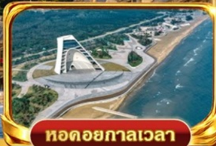
หอดอยกาลเวลา