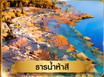
ธารน้ำห่าสี

อุหลุมู่จี • ธารน้ำห่าสี • แกรนด์แคนยอนขุยถุน • หมู่บ้านเหม่ย