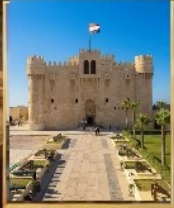
อเล็กซานเดีย