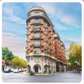
ถนนอู๋คัง