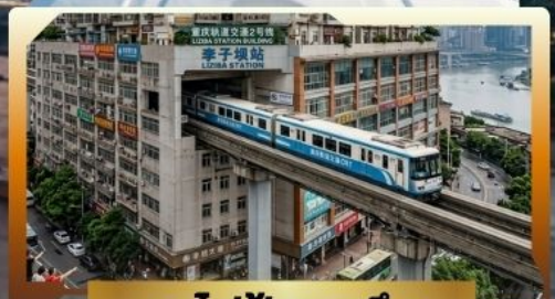
รถไฟฟ้ากะลุ่ก