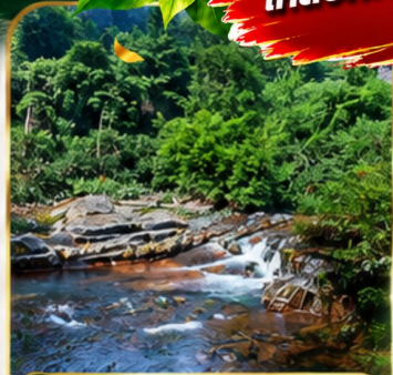
อุทยานฟงเลี่ยนซี