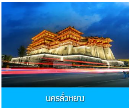
นครฉว่หยาง