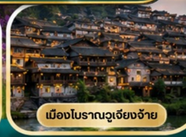
เมืองโบราณฉูเจียงจ้าย