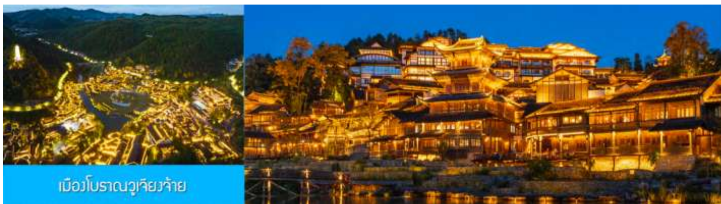
เมืองโบราณวูเจียงจ้าย

หลังอาหารนำท่านเที่ยวชม เมืองโบราณวูเจียงจ้าย 乌江寨景区 เป็นอุทยานท่องเที่ยวชมเมืองโบราณชนเผ่าเหมียว (ชนเผ่าม้ง) ที่ได้ชื่อว่ามีวิวกลางคืนที่สวยงามที่สุดของมณฑลกุ้ยโจว อุทยานนี้รวมไว้ซึ่งแหล่งท่องเที่ยว สถานที่ถ่ายภาพยนตร์ ร้านอาหาร รีสอร์ท ศูนย์ประชุม ด้วยทุนสร้างกว่าหมื่นล้านหยวน สัมผัสบ้านเรือนโบราณของชนเผ่าเหมียว ซึ่งเป็นชนกลุ่มหลักที่พำนักในพื้นที่มานาน ปัจจุบันชนเผ่าเหมียวยังคงรักษาไว้ซึ่งขนบธรรมเนียมและวิถีชีวิตแบบดั้งเดิม ชมการแสดงพื้นเมือง และการละเล่นพื้นเมืองของชนกลุ่มน้อยต่างๆ ในช่วงหัวค่ำบ้านทุกหลังในอุทยานจะประดับด้วยแสงไฟที่งดงาม และมีการแสดงต่างๆ อาทิ การบินโดรน น้ำพุ และการยิงแสงเลเซอร์ ฯลฯ (ค่าทัวร์รวมค่ารถรับส่งภายในเขตอุทยาน ค่าทัวร์ไม่รวมค่านั่งเรือแจวในเขตอุทยาน)