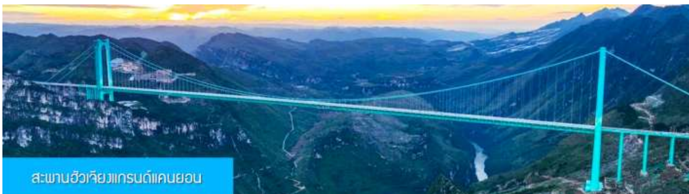
สะพานฮัวเจียงแกรนด์แคนยอน

พักที่ WINDHAM HOTEL โรงแรมระดับ 4 ดาวท้องถิ่นในเมืองอันซุ่น