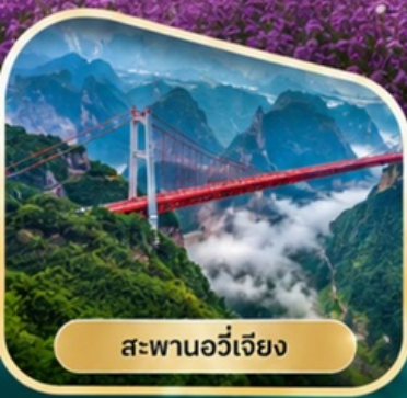
สะพานอวีเจียง