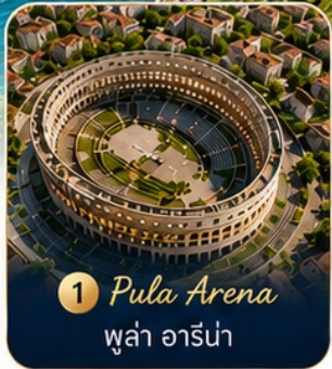
1 Pula Arena ปูลา อารีน่า