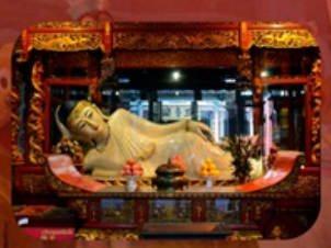
สักการะวัดพระหยกขาว