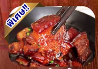
เมนูหมูสามชั้นตุ๋นน้ำแดง

พักโรงแรม 4 ดาว ★★★★★ ฟรี ประกันอุบัติเหตุ บริการอาหารท้องถิ่น