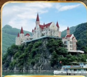
ล่องทะเลสาบวั้นเฟิงหู