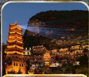
หมู่บ้านโบราณเฟิงหลินชู่ (รวมรถแบต)