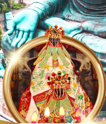
ยืมเงินเจ้าแม่กวนอิมสองฮา