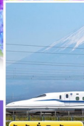
สัมปั่งนั่งชินคันเซน