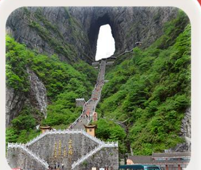
“กำแพงสุพรรณ”