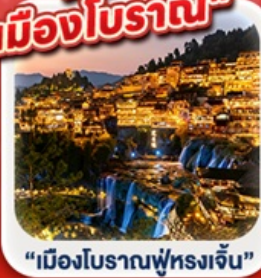
“เมืองโบราณฟูหรงเจิน”