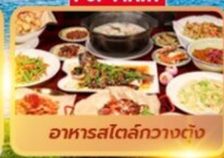
อาหารสไตล์กวางต้ง