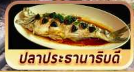
ปลาประจานารับดี