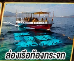
ล่องเรือท้องกระจก