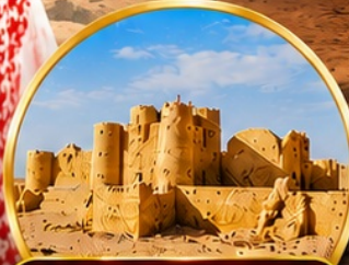
กลุ่มปราสาททะเลทราย (Desert Castles)