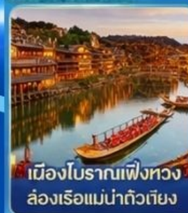
เมืองโบราณเฟิงหวง ล่องเรือแม่น้ำถั่วเจียง