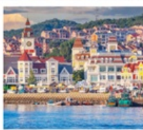
ท่าเรือประมงเขียนโก๋

เรือลิววิค / ย่านฮั่นเล่อฟาง / ถนนฮั่วจวิปา ท่าเรือประมงเขียนโก๋ / ย่านฮองโหว่ 1920 / ถนนโบราณเฉาหยาง หอคอยกาลเวลา / ชายหาดจินซา / รูปปั้นปลาวาฬ / หาดทรายซาจื่อโหว่ หาดไซเบอร์ NO.3 / โรงงานเบียร์ชิงเต่า / โบสถ์ St. Emil ถนนคนเดินไต้ตง / สะพานจันเฉียว / จัตุรัส 54 / ห้าง MIXC