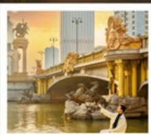
ย่านอิตาลี