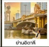
ย่านอิตาลี