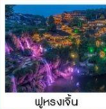
ฟูหรงเจิน