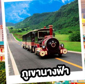
ภูเขาทางฟ้า