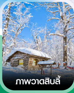
ภาพวาดสีบลู