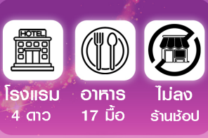
โรงแรม 4 ทั่ว