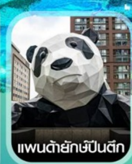
แพนด้ายักษ์ปิ่นตีก