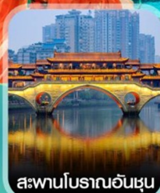
สะพานโบราณอันชุน